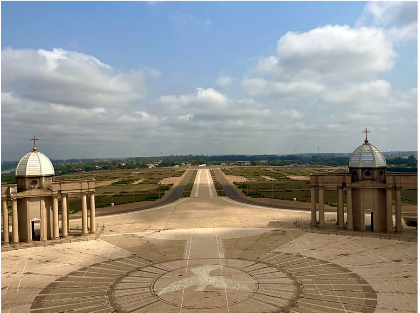
Basilique Notre-Dame de la Paix, a templom előtere

Levezetesként, mielőtt elkezdnénk párhuzamokat keresni mondjuk Felcsút és Yamoussoukro, az új főváros között lássuk a három látnivaló közül a továbbiakat a wannabe fővárosból: