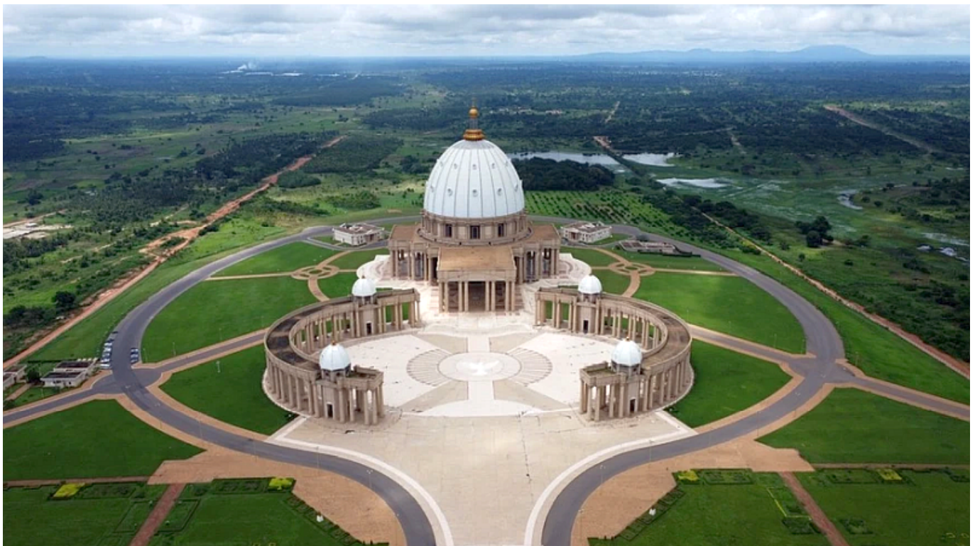
Basilique Notre-Dame de la Paix, a világ legnagyobb katolikus temploma

Mint például ebben az esetben, ugyanis a világ legnagyobb keresztény temploma nem a Vatikánban található, még csak nem is Izraelben, ahol a vallás született, hanem – ta-ta-ta-tam – Afrikában.