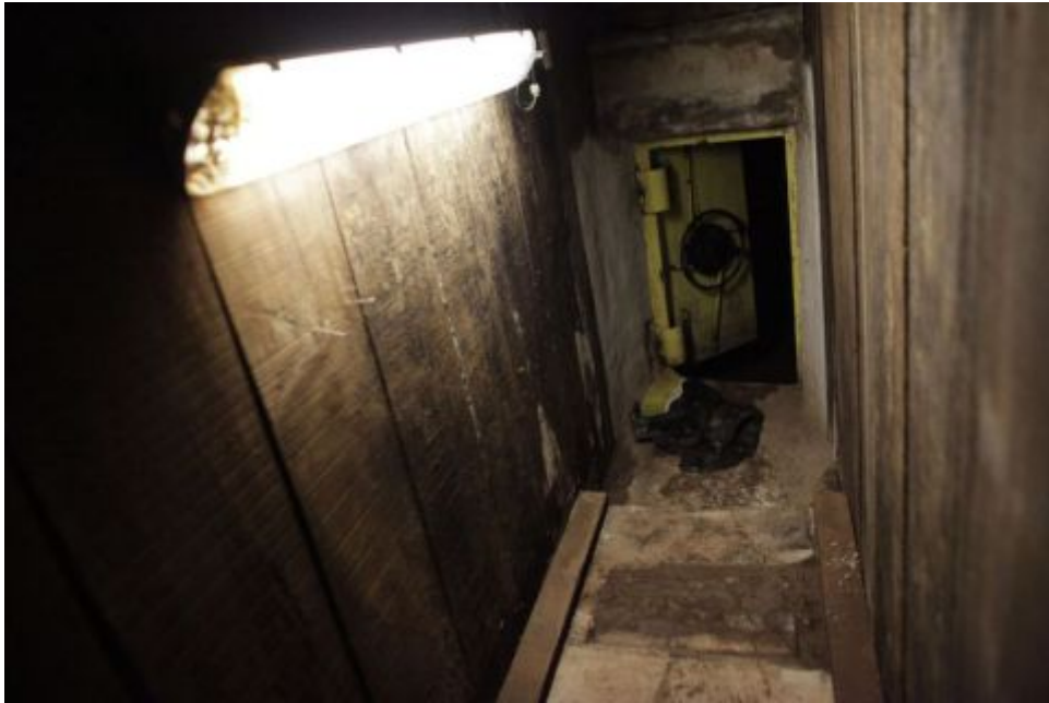
A csatorna a ház alatt: