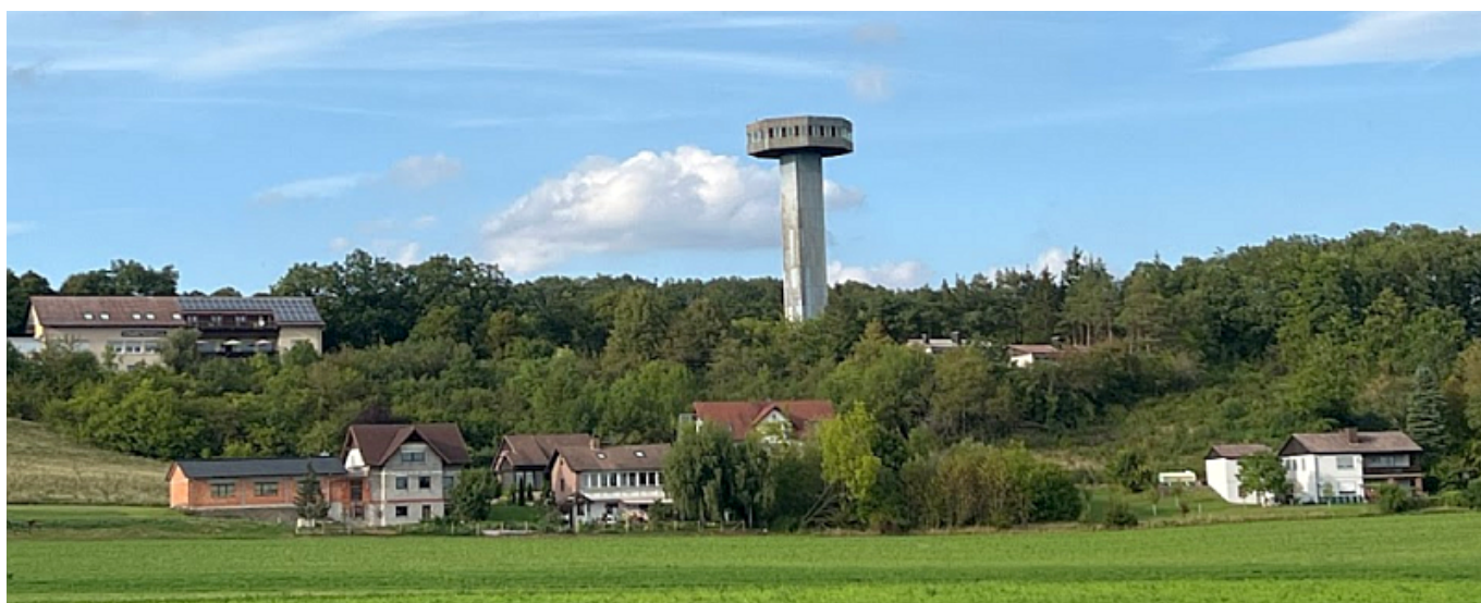
Bayernturm, a funkcióját veszett kilátó

A második világháború után kettéosztott Németország szovjet befolyásoltág alá tartozó keleti oldala egy, a magyarhoz hasonló berendezkedésű szocialista állammá vált. Az alapvetően a rendszerbe kódolt paranoia itt viszont csúcsra járt, ugyanis a szomszédos ország, az NSZK volt az ország egykori nyugati fele, és – minő meglepő következmény – gazdaságilag, politikailag sokkal jobban muzsikált a kettéválás után, mint a nyomorultabb „szovjet” NDK. Nyilván a keletiek is bizonyítani akartak, hogy ők is vannak olyan jók, mint az NSZK, csak hogy a szocialista tervgazdálkodás soha nem volt alkalmas arra, hogy versenyezzen a szabadpiaccal, így ők a képzelt előnyüket hazugságokra, megfélemlítésre és brutális besúgóhálózatra építették.